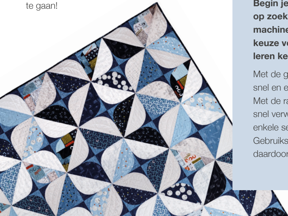
Quilt door Brigitte Heitland, Zen Chic.

Dat is de reden waarom wij onze A-serie hebben ontworpen, speciaal voor jou. Een familie moderne naaimachines boordevol krachtige functies waarmee je elk project aankunt, om met plezier mee aan de slag te gaan!